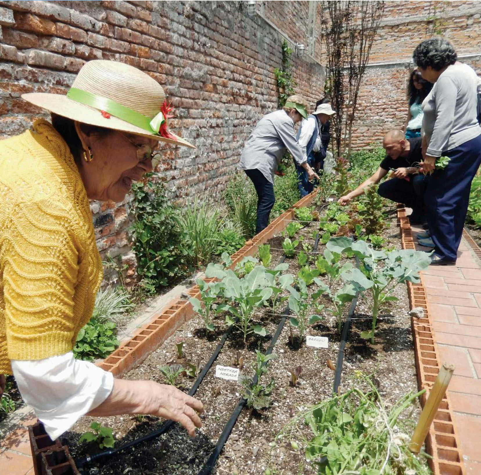
Ferme urbaine/Urban Farm.