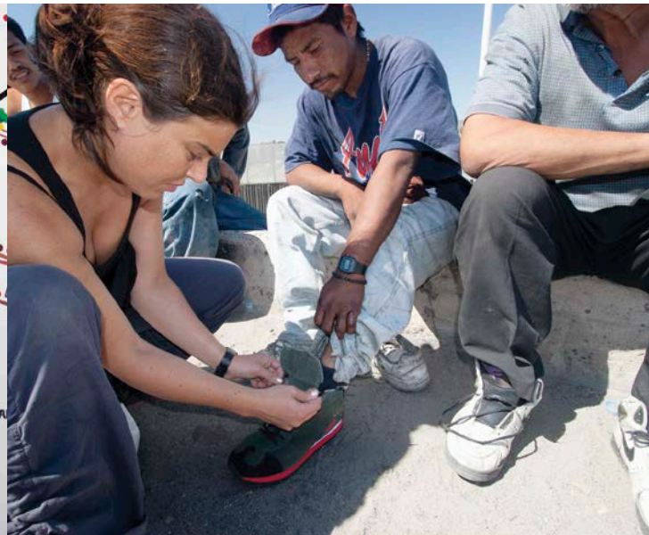
Mark Bradford, Maleteros , 2005

InSite represents a model as regards an exhibition/event/biennale tied to a location and its issues, notably because it maintains an experimental character from one edition to the next, adapting to the context the border creates and the practices of the invited artists. The initiatives the team members undertook for the 2002 and 2005 iterations helped make inSite truly a space of exchange and reflection and brought the artists and certain social and community groups working around the border closer together. In fact, these two editions indicated a desire to support critical, dialogic, and participative or situated 1 practices, and practices operating in the mode of infiltration-based art. 2 They also tended towards extradisciplinary, 3 due to the presence of practitioners from various backgrounds, who were invited to interact with artists and participants both on the site and in the context of workshops and panels. The formulation of the 6 th edition leads one to believe that this trajectory will only grow more pronounced under the artistic direction of loyal inSite collaborator, Osvaldo Sánchez.