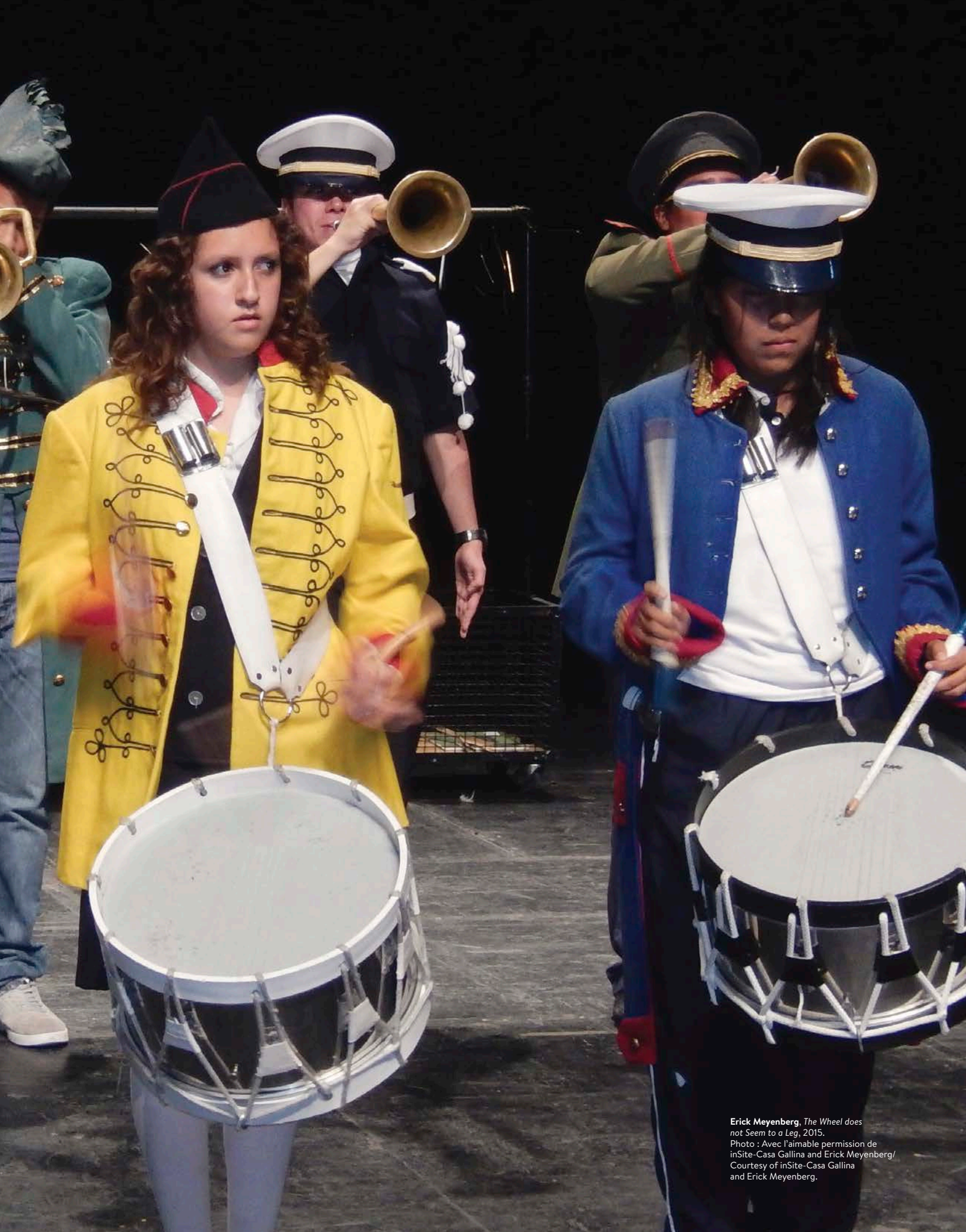
Erick Meyenberg, The Wheel does not Seem to a Leg , 2015.