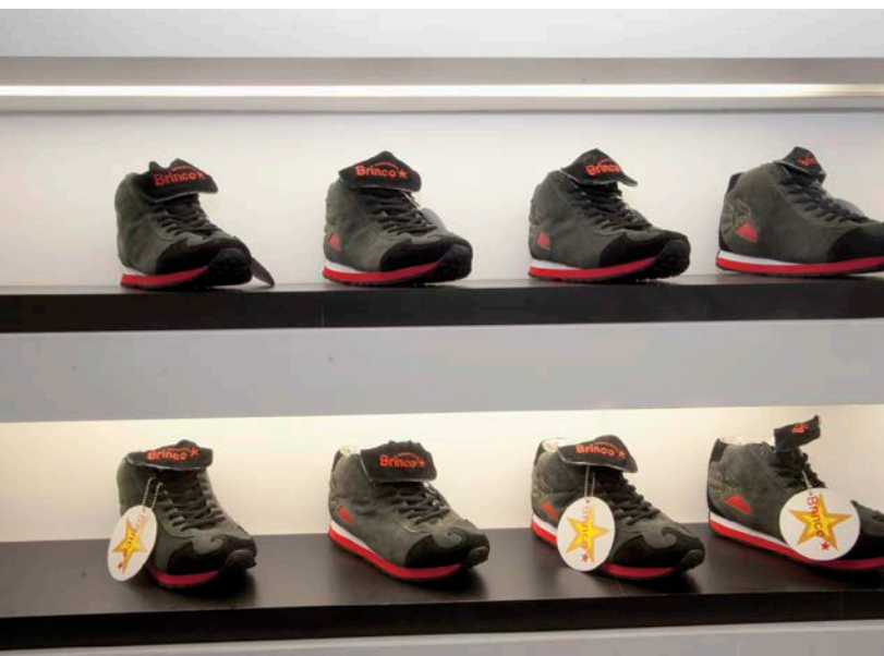
Judi Werthein, Brinco , 2005

InSite représente un modèle en matière d'exposition/événement/ biennale lié à un site et à ses enjeux, notamment parce qu'il a conservé un caractère expérimental d'une édition à l'autre afin de s'adapter à la pratique des artistes invités et au contexte d'implantation que constitue la frontière. Les initiatives entreprises par les membres de l'équipe impliqués dans les itérations de 2002 et 2005 ont contribué à faire d'inSite un véritable espace d'échange et de réflexion et à rapprocher les artistes de certains groupes sociaux et communautés gravitant autour de la frontière. Ces deux éditions ont en effet été marquées par un désir de soutenir des pratiques critiques, dialogiques, participatives, situées 1 et opérant à la manière de l'art infiltrant 2 tout en cherchant à tendre vers l'extradisciplinaire 3 , à travers la présence de praticiens issus de divers horizons invités à interagir sur le terrain avec les artistes et les participants ainsi que dans le contexte d'ateliers et de conférences. La formulation de la 6 e édition porte à croire que cette trajectoire s'accroîtra sous la direction artistique d'Osvaldo Sánchez, fidèle collaborateur d'inSite.